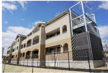
特別養護老人ホーム グランツァ