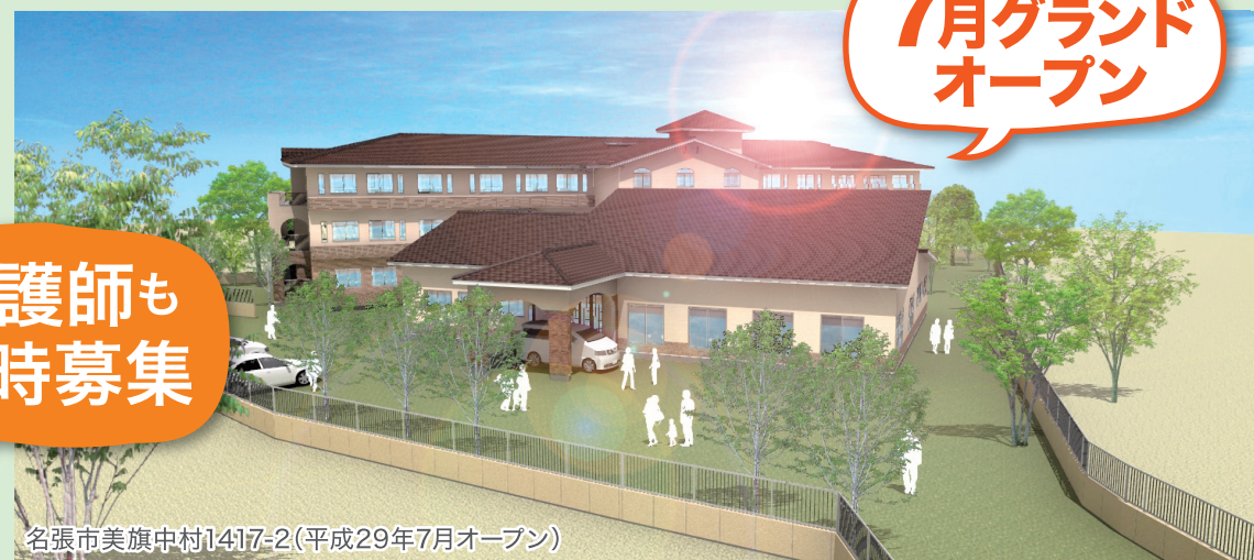
名張市美旗中村1417-2（平成29年7月オープン）

今年7月に開所する特別養護老人ホームのオープニングスタッフとして、 入居者の着替え、食事や入浴といった介助など 日常生活全般を支援する介護職員や看護師を募集します。